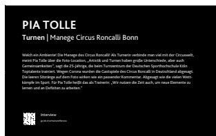
Turntrainerin Pia Tolle